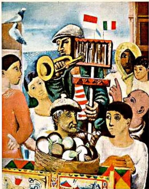
Christian Hess: « L'indovino », olio su tela

Elenco delle opere e loro sistemazione negli imballaggi →