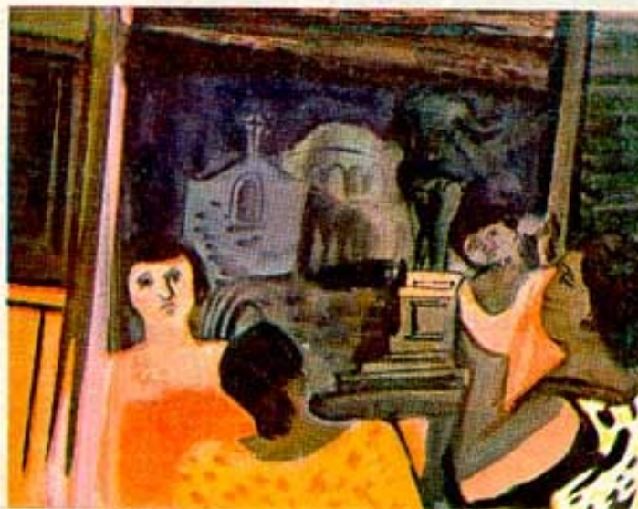
Volk beim Fest Popolo in festa